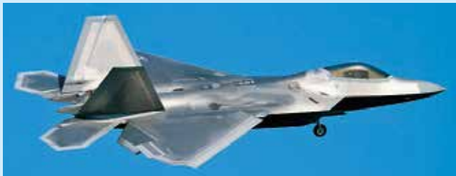
F-22A ラプター戦闘機（ローテーション配備）