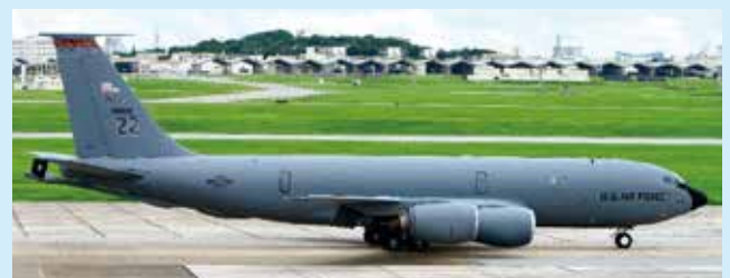
KC-135R ストラトタンカー空中給油/医療輸送機