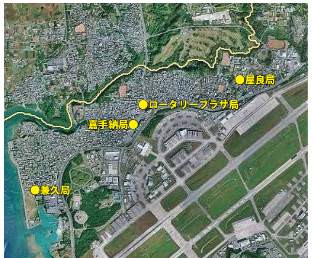
町設置騒音測定局位置図