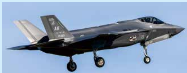
F-35A ライトニングII 戦闘機（ローテーション配備）