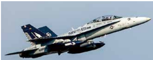
FA-18D ホーネット戦闘攻撃機