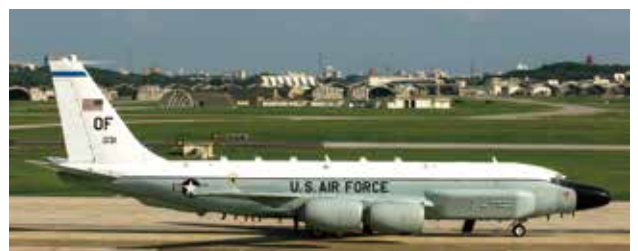
RC-135W リベットジョイント電子偵察機