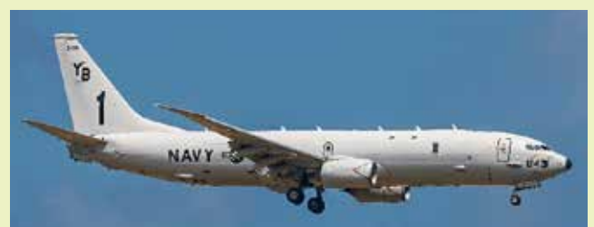
P-8A ポセイドン対潜哨戒機