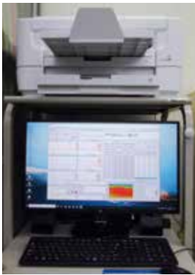
航空機騒音測定器