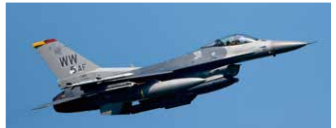
F-16C ファイティングファルコン戦闘機