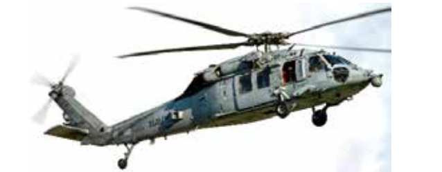
MH-60S ナイトホーク多用途ヘリ