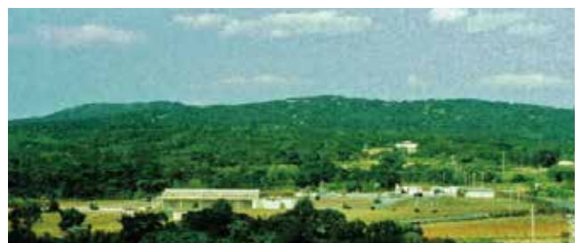
嘉手納弾薬庫地区 Kadena Ammunition Storage Area