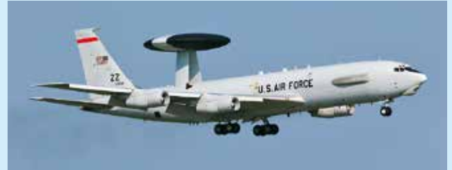
E-3 セントリー空中早期警戒管制機