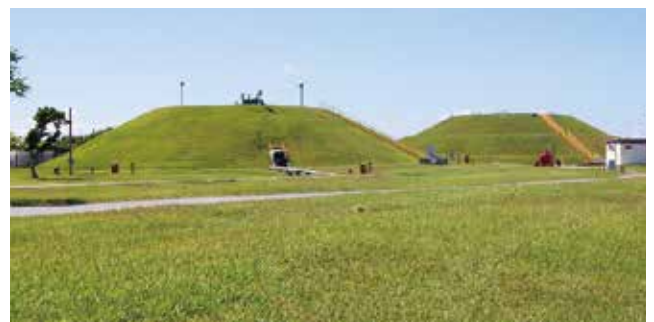
陸軍貯油施設 Army POL Depots

施設を連結する送油管は、以前は那覇港湾施設から嘉手納飛行場に至る北上ラインと天願棧橋から嘉手納飛行場及び普天間飛行場へ送る南下ラインがあって、基地間を連結していた。北上ラインについては、那覇港湾施設の全面返還合意に伴い、那覇港湾施設タンク地区(昭和61年返還)の18基の代替タンクを金武第1、第2、第3タンクファーム及び桑江タンクファームに建設し、その機能が移設されたことにより北上ラインは完全に撤去された。南下ラインは、金武タンクファームから嘉手納弾薬庫地区、嘉手納飛行場、桑江ブースターステーション、キャンプ瑞慶覧を通して普天間飛行場までの送油管施設が残っている。送油管は2~4本からなり、金武湾沖合の石油ポイントからジェット燃料やガソリン、ディーゼル燃料等を主要な米軍基地へ送っている。