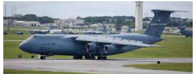
C-5 ギャラクシー輸送機