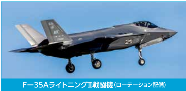
F-35A ライトニングII戦闘機(ローテーション配備)