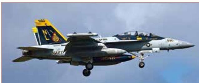
EA-18G グラウラー 電子作戦機