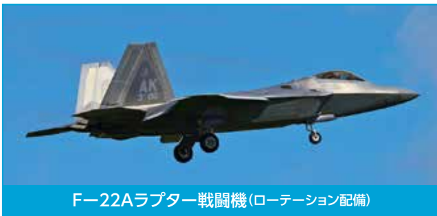
F-22A ラプター戦闘機(ローテーション配備)