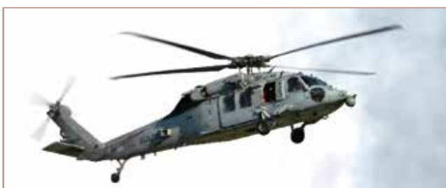
MH-60S ナイトホーク 多用途ヘリ