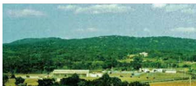
嘉手納弾薬庫地区 Kadena Ammunition Storage Area