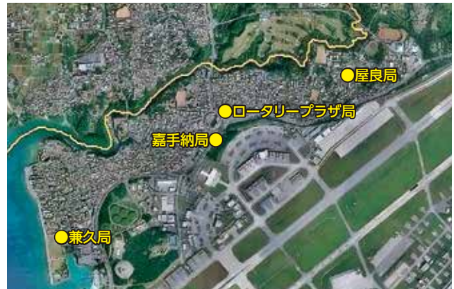
町設置騒音測定局位置図