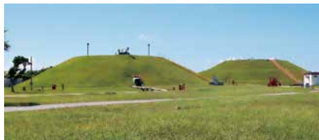
陸軍貯油施設 Army POL Depots

施設を連結する送油管は、以前は那覇港湾施設から嘉手納飛行場に至る北上ラインと天願棧橋から嘉手納飛行場及び普天間飛行場へ送る南下ラインがあって、基地間を連結していた。北上ラインについては、那覇港湾施設の全面返還合意に伴い、那覇港湾施設タンク地区 (昭和61年返還) の18基の代替タンクを金武第1、第2、第3タンクファーム及び桑江タンクファームに建設し、その機能が移設されたことにより北上ラインは完全に撤去された。南下ラインは、金武タンクファームから嘉手納弾薬庫地区、嘉手納飛行場、桑江ブースターステーション、キャンプ瑞慶覧を通して普天間飛行場までの送油管施設が残っている。送油管は2~4本からなり、金武湾沖合の石油ポイントからジェット燃料やガソリン、ディーゼル燃料等を主要な米軍基地へ送っている。