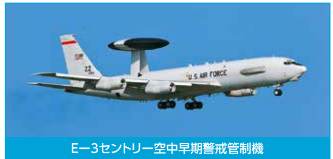
E-3 セントリー空中早期警戒管制機