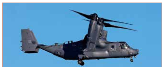
CV-22B オスプレイ 輸送機