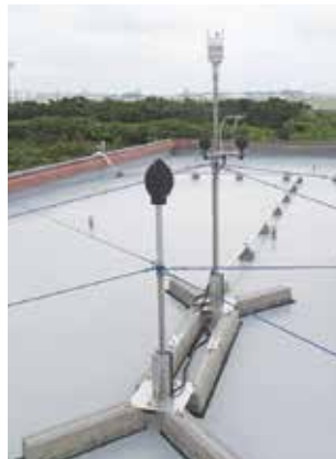
航空機騒音測定器