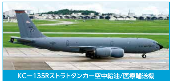
KC-135R ストラトタンカー空中給油/医療輸送機