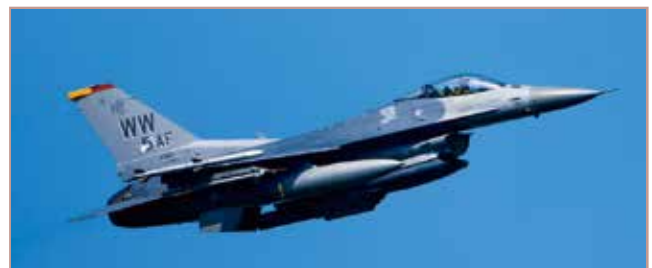
F-16C ファイティングファルコン 戦闘機