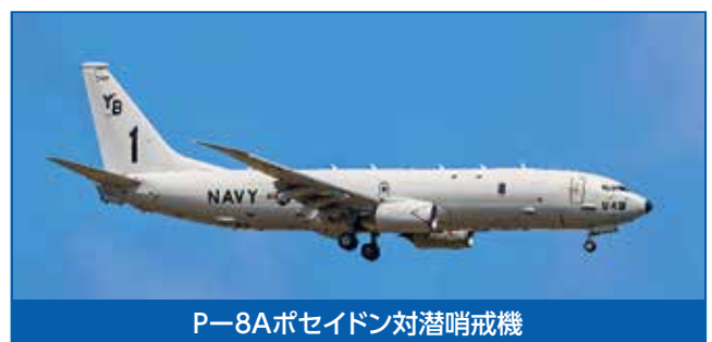
P-8A ポセイドン対潜哨戒機