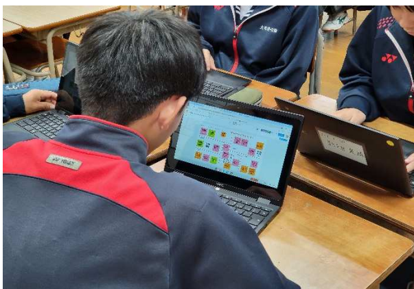
集めた情報を整理・分析する生徒