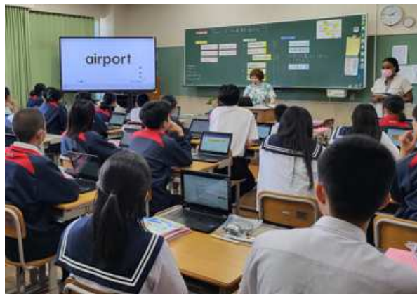
英語：Tina にメールの返事を送るなら？