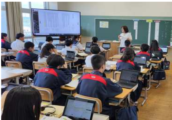
国語：疎開した父の気持ちを考える！

7月4日、嘉手納町リーディングDXスクール（嘉手納中学校）の第1回公開授業及び公開研究会がありました。本研究会には、県内外から247名の先生方が参加しました。以下に、その時の授業や研究会の様子を紹介します。