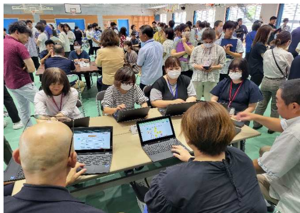
小中の先生方による意見交流