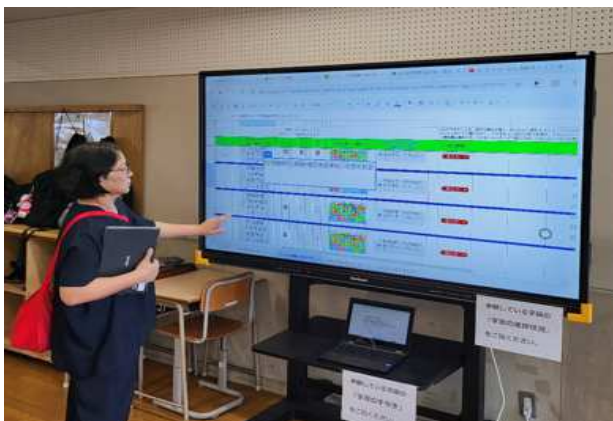
生徒全員の学習状況がわかるモニター