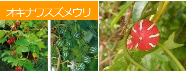
オキナフスズメウリ