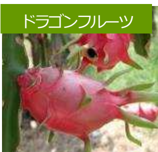
ドラゴンフルーツ