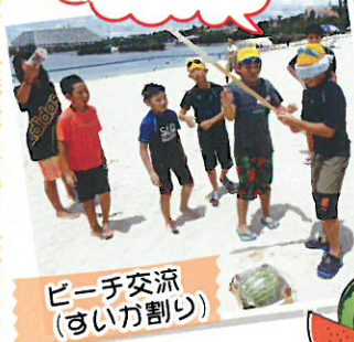
ビーチ交流(すいか割り)