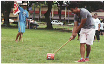
町人会ビクニック(ゲーム)