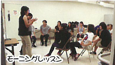
モーニングレッスン