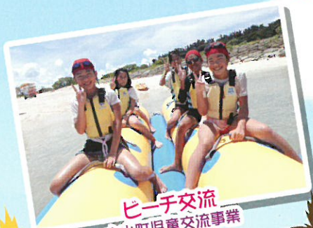
ビーチ交流 大山町児童交流事業