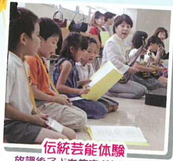
伝統芸能体験 放課後子ども教室(芸能教室)