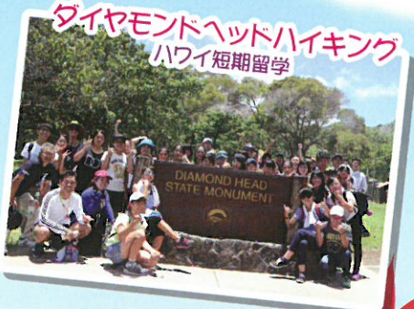
ダイヤモンドヘッドハイキング ハワイ短期留学