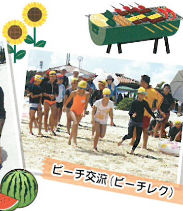
ビーチ交流(ビーチレク)