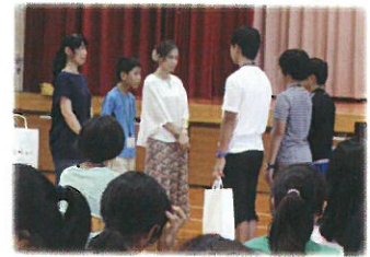
児童と民泊家庭の顔合わせ