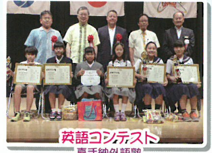
英語コンテスト 嘉手納外語塾