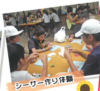
シーサー作り体験