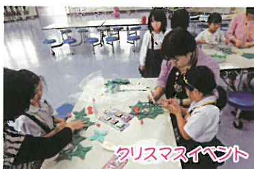
クリスマスイベント