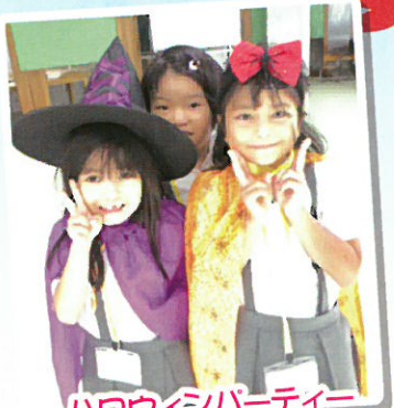
ハロウィンパーティー 放課後子ども教室