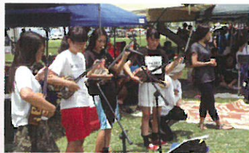
町人会ビクニック(派遣生達によるアトラクション)