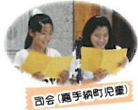
司会(嘉手納町児童)

この事業は、次代を担う子ども達が、冬(派遣)・夏(受入)の交流内で異なる生活環境や文化・歴史を学び、貴重な体験活動を経験することにより、人材育成を図ることを目的としています。今年度も多くの関係者の協力のもと、有意義な内容となりました。また、大山町への派遣については1月下旬を予定しております。