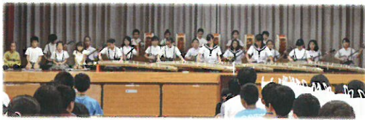
アトラクション(放課後子ども教室・かこな子ども芸能サークル)