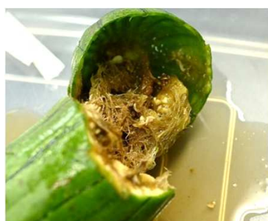
加害されたヘチマ