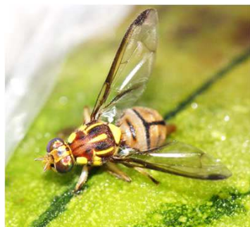
セグロウリミバエ成虫