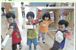
キューレンジャーごっこ