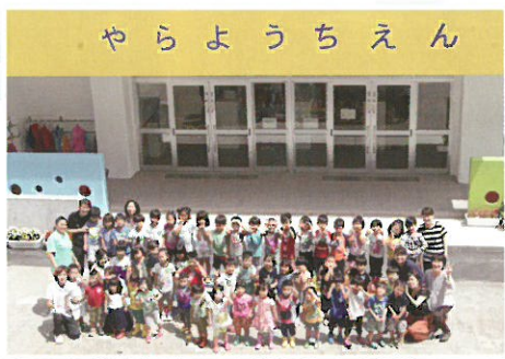
屋良幼稚園 新園舎