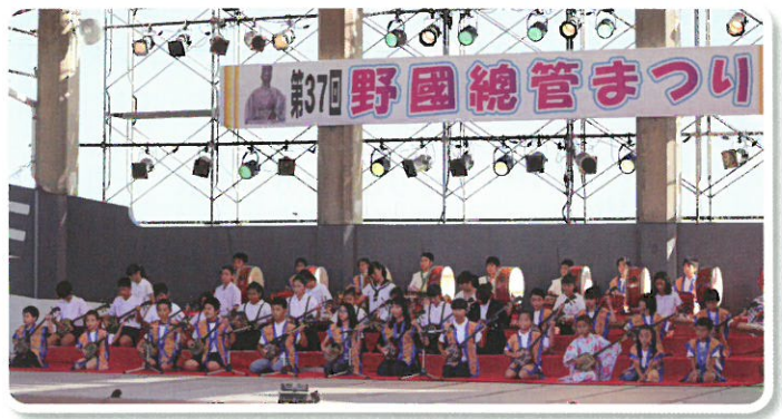
野國總管まつり出演