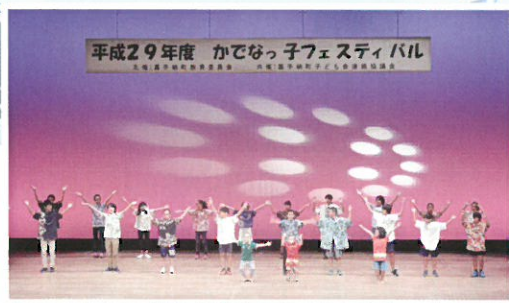
かでなっ子フェスティバル 西区子ども育成会「ダンス」