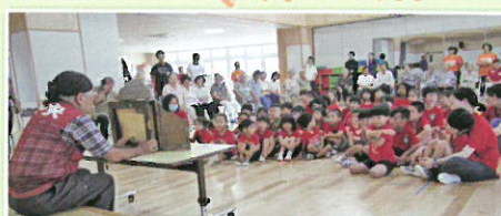
あしびなー会との交流