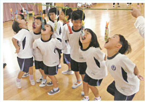
嘉手納幼稚園 ミニ運動会