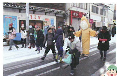
水木しげるロード散策