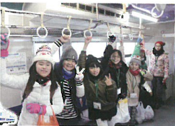
鬼太郎列車での乗車体験