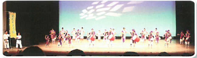
北区子ども育成会「北区エイサー」