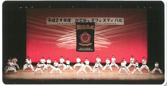
上地流空手道拳優会「空手演武」

各区の子ども育成会や文化協会など、様々な団体から子どもたちが出演し、元気いっぱいに舞台発表を行いました。