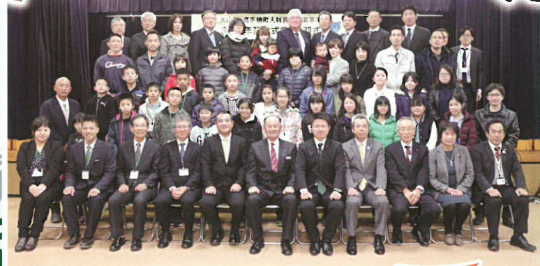
大山町児童交流事業 30回目記念式典、交流団歓迎会