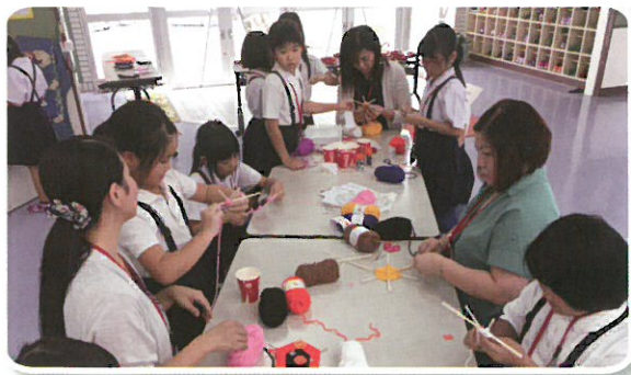
ハロウィングッズ作り