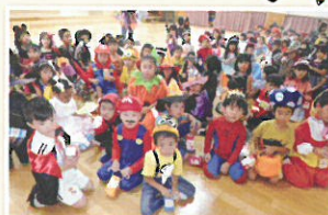
ハロウィーンパーティー