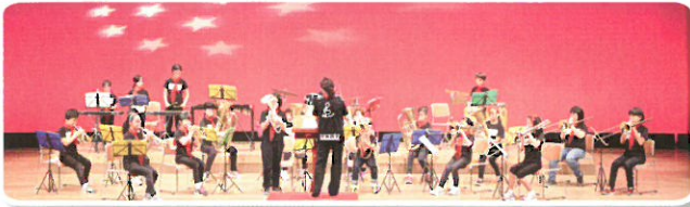
嘉手納小学校音楽部「We love music♪」