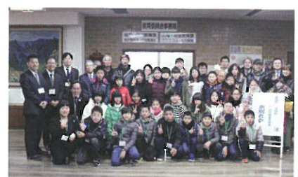
お世話になった大山町の皆さんと