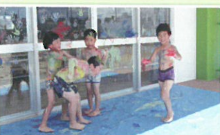
ポティーペインティング