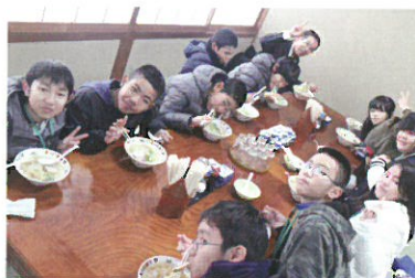
お昼は牛骨ラーメン