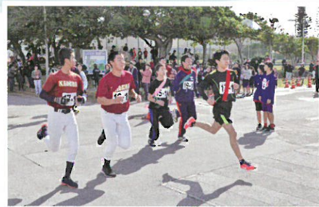
町民新春マラソン大会