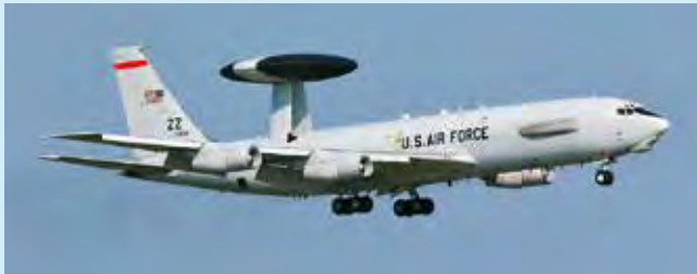
E-3セントリー空中早期警戒管制機