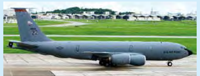
KC-135R ストラトタンカー空中給油/医療輸送機