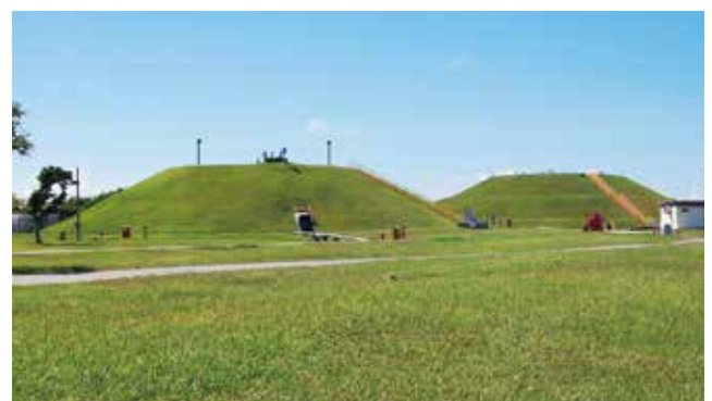
陸軍貯油施設 Army POL Depots

施設を連結する送油管は、以前は那覇港湾施設から嘉手納飛行場に至る北上ラインと天願棧橋から嘉手納飛行場及び普天間飛行場へ送る南下ラインがあって、基地間を連結していた。北上ラインについては、那覇港湾施設の全面返還合意に伴い、那覇港湾施設タンク地区(昭和61年返還)の18基の代替タンクを金武第1、第2、第3タンクファーム及び桑江タンクファームに建設し、その機能が移設されたことにより北上ラインは完全に撤去された。南下ラインは、金武タンクファームから嘉手納弾薬庫地区、嘉手納飛行場、桑江ブースターステーション、キャンプ瑞慶覧を通して普天間飛行場までの送油管施設が残っている。送油管は2~4本からなり、金武湾沖合の石油ポイントからジェット燃料やガソリン、ディーゼル燃料等を主要な米軍基地へ送っている。