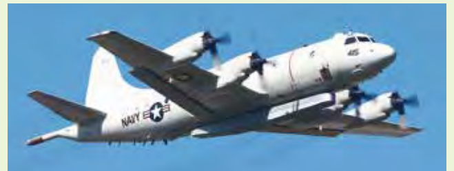
P-3C オライオン対潜哨戒機