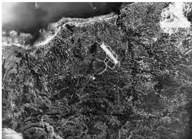
旧日本陸軍中飛行場

また、陸軍貯油施設として嘉手納タンクファームがある。米軍は昭和20年から27年にかけて、嘉手納町、北谷町、那覇市、具志川市(現うるま市)にタンクファームを建設し、昭和27年から28年にかけて、これらの施設間のパイプラインを敷設して連結し、米軍の主要基地間を結ぶ動脈としてジェット燃料やガソリンなどを送油している。