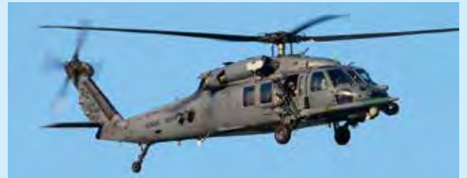
HH-60G ペイブホーク救難機