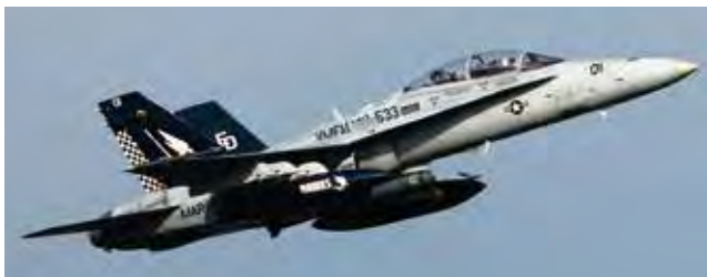
FA-18D ホーネット戦闘攻撃機