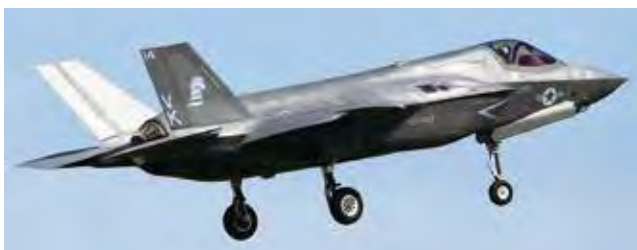
F-35B ライトニングII戦闘機