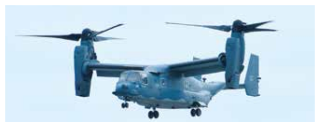
CV-22B オスプレイ輸送機