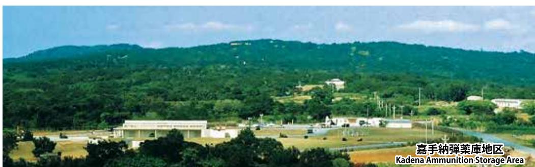
嘉手納弾薬庫地区 Kadena Ammunition Storage Area