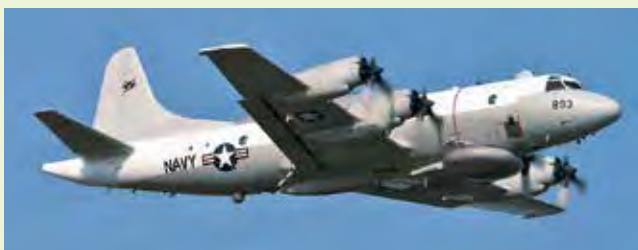
EP-3EアリーズII 電子偵察機