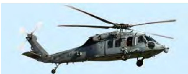
MH-60S ナイトホーク多用途ヘリ