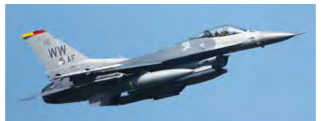
F-16C ファイティングファルコン戦闘機