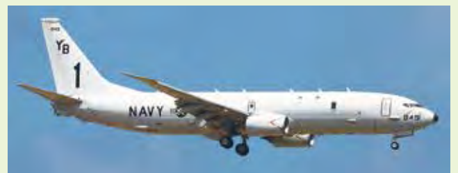
P-8A ポセイドン対潜哨戒機