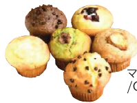
マフィン / Charm