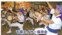
千原エイサー保存会