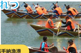
町総合福祉センター・嘉手納漁港

海事の安全と豊漁を願い、漁民によるハーリーや職域による競争、子どもハーリーなどが行われます。