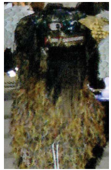
東区獅子舞保存会