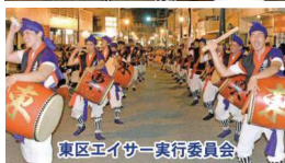
東区エイサー実行委員会