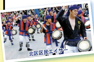
北区区民エイサー